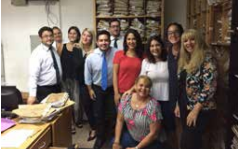
Equipo de Trabajo del Juzgado Civil 7

Reiteramos la invitación para el envío de fotografías de los equipos de trabajo y de los edificios donde funcionan las dependencias del Poder Judicial donde desarrollan sus tareas.